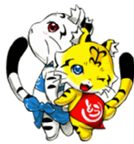
東かがわ市しあわせづくりキャラクター “ハートラ” & “トラッピー”