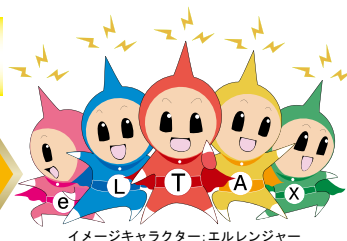
イメージキャラクター:エルレンジャー

eLTAXをご利用いただくにあたり、パソコン環境やインターネット接続環境、必要に応じて電子証明書などを事前に準備していただく必要があります。これらの準備には費用が必要なものもあります。