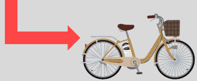
電動自転車を貸出し周辺観光地へ

マーレリッコ2階の空きスペースに安戸池を臨むワークスペースを整備あわせて、オンラインミーティング等で活用できる個室ブースを設置