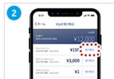
[受け取る]をタップ