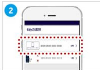
受け取りを行う楽天Edyを選択