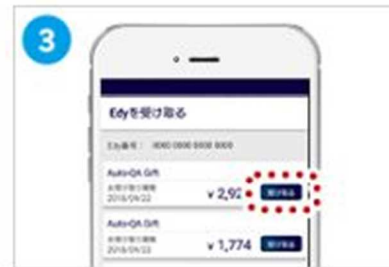
[受け取る]をタップ