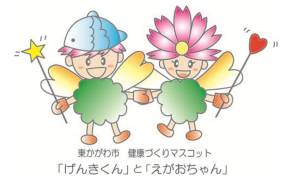
東かがわ市 健康づくりマスコット 「げんきくん」と「えがおちゃん」