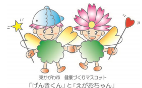
東かがわ市 健康づくりマスコット 「げんきくん」と「えがおちゃん」