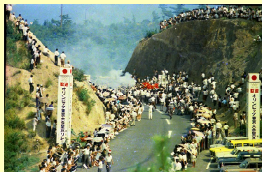
引田 東京オリンピック聖火リレー