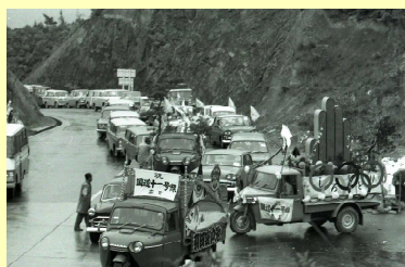
引田 国道11号開通パレード