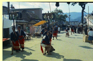
引田 菅田八幡宮 秋の大祭