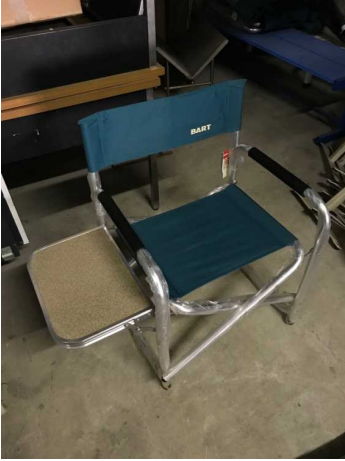
⑥ 折りたたみ椅子(ミニテーブル付)