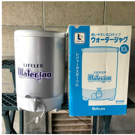
⑦ 給水器(ウォータージャグ)10L