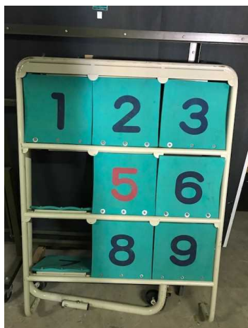
⑬ ストラックアウト