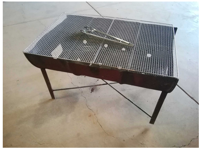
⑪ バーベキューコンロ