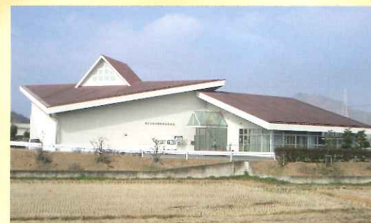
MUSEUM OF HISTORY HIGASHI KAGAWA CITY