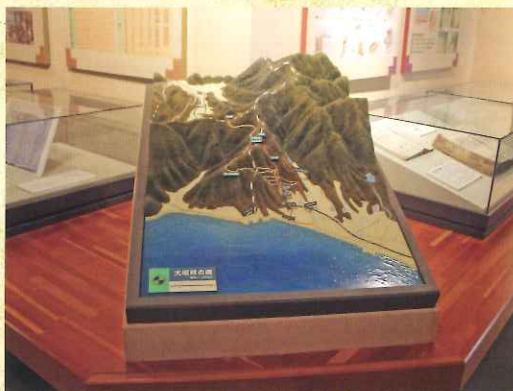
歴史の道 100 選 大坂峠のジオラマ