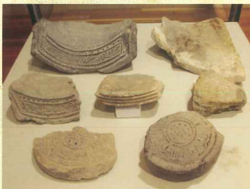
県指定文化財白鳥廃寺跡から出土した瓦