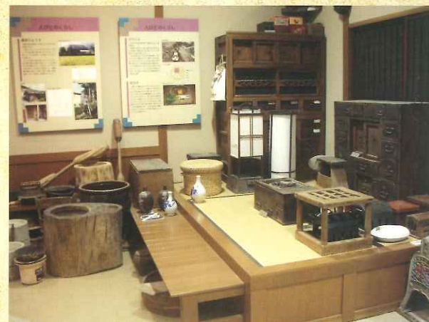
昔の生活コーナー