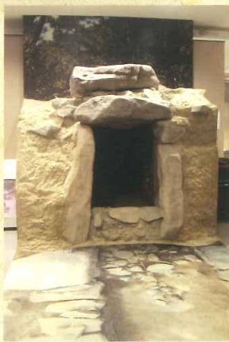
市指定文化財川北一号墳 実物大レプリカ

東かがわ市歴史民俗資料館 MUSEUM OF HISTORY HIGASHI KAGAWA CITY