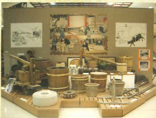
砂糖づくりの道具