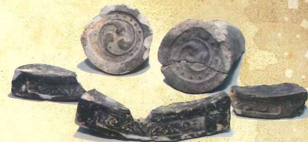
引田城跡から出土した瓦