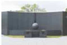
宇治市 合葬式墓地

答 近年、墓じまいの改葬許可の申請も年間60件を超えている。現時点では建設を考えていないが、人口減少と少子高齢化による墓地を取り巻く状況は変化している。市民ニーズのアンケート等を行い、調査研究してまいりたい。