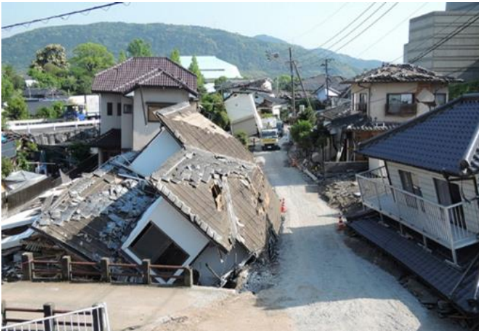
熊本地震(2016年・最大震度7)の被害状況写真

そこで、東かがわ市ではお住まいの住宅が地震に対してどれだけ強いかわかる「耐震診断」と、 その結果に基づいて住宅に耐震対策を施す「耐震改修工事等」への補助制度を設けております。