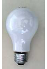
白熱電球 (不燃ごみ)