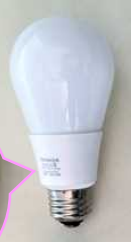
電球型蛍光管 (水銀含有ごみ)