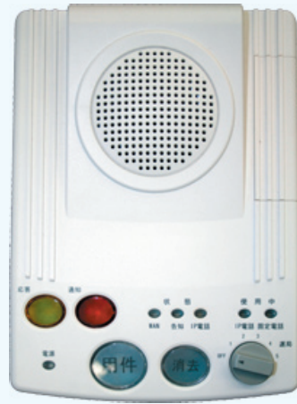
▲市が設置する告知放送端末 大きいボタンで操作も簡単

A 今年度は端末の設置にかかる費用（ただし標準工事費内）は市が負担します。端末の機器は市からの無償貸与です。端末の使用にかかる費用としては毎月の電気代（200～300円）です。