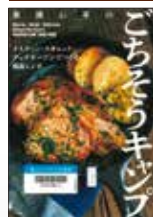
栗原心平/著(小学館刊) 『栗原心平のごちそうキャンプ』

県民食のうどんがスキレットでお手軽ランチにスキレット、メスティン、グッチオープンなど、キャンプ用品店などで見える道具ごとの料理法が紹介されていて今すぐ作ってみたいくなります。