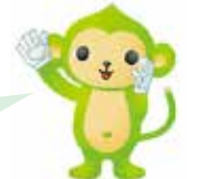
香川県ゲートキーパー推進キャラクター「きーもん」

それでもこころが辛い時には「話す」ことも、不安を「離す」一つの方法です。不安なとき、困ったときの相談窓口があります。