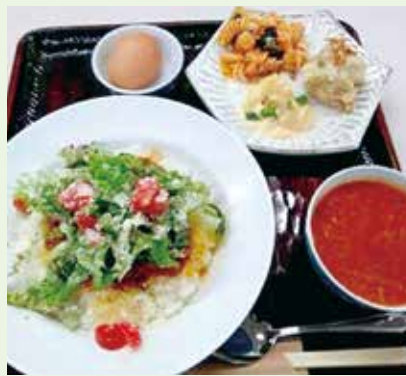
投稿者 三本松高校