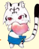
東かがわ市しあわせづくり キャラクター トラッピー

大内交流館と引田交流館は、さまざまな交流事業を通して、人と人がお互いを尊重し合う“人にやさしいまちづくり”をめざす拠点です。 乳幼児から高齢の人まで、たくさんの人に来ていただき、交流の輪が広がっています。ここでは、そのほんの一部を紹介します。