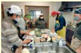
▲男の料理教室(引田交流館)

◇男の料理教室 (大内交流館・引田交流館)・パソコン教室(引田交流館)などを開催しています。