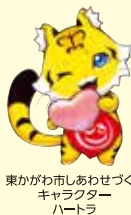
東かがわ市しあわせづくり キャラクター ハートラ

大内交流館と引田交流館は、さまざまな交流事業を通して、人と人がお互いを尊重し合う“人にやさしいまちづくり”をめざす拠点です。 乳幼児から高齢の人まで、たくさんの人に来ていただき、交流の輪が広がっています。ここでは、そのほんの一部を紹介します。